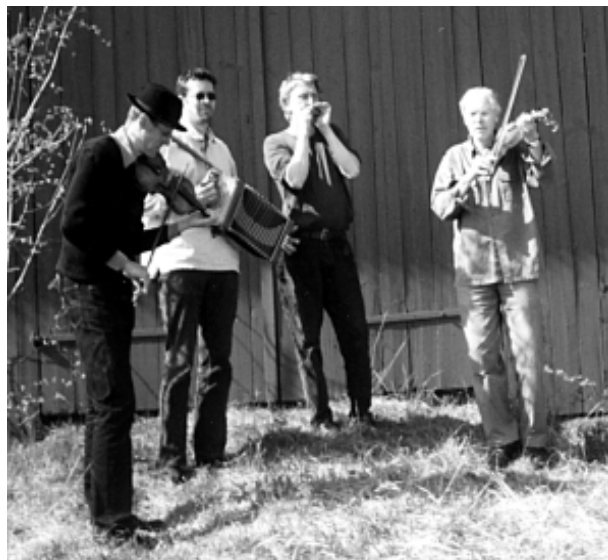
Riksspelemännen värmer upp.

Vi lämnar bäcken och följer vägen efter Smällebergshöjderna och kommer fram till ”Trångeklev” vi har nu gått ungefär halva vägen. Här är det ett smalt pass som utgör slutet på en lång stigning av vägen. Här var den naturliga rastplatsen för ”likbärarna” här satte man