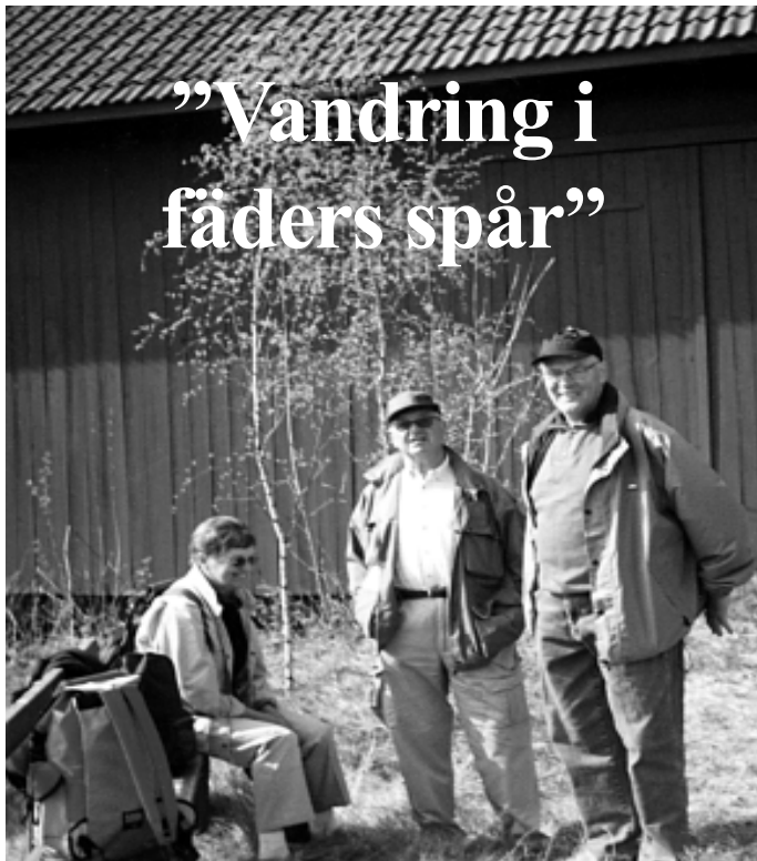
Redaktören med sällskap redo för ”Kyrkvandringen”

Det kom en inbjudan att delta i en vandring mellan Vråka och Västra Ed, man skulle inviga den gamla kyrkvägen som en gång gått mellan dessa platser. Jag blev nyfiken och tackade ja.